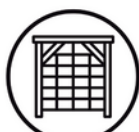
JUEGO DE RED